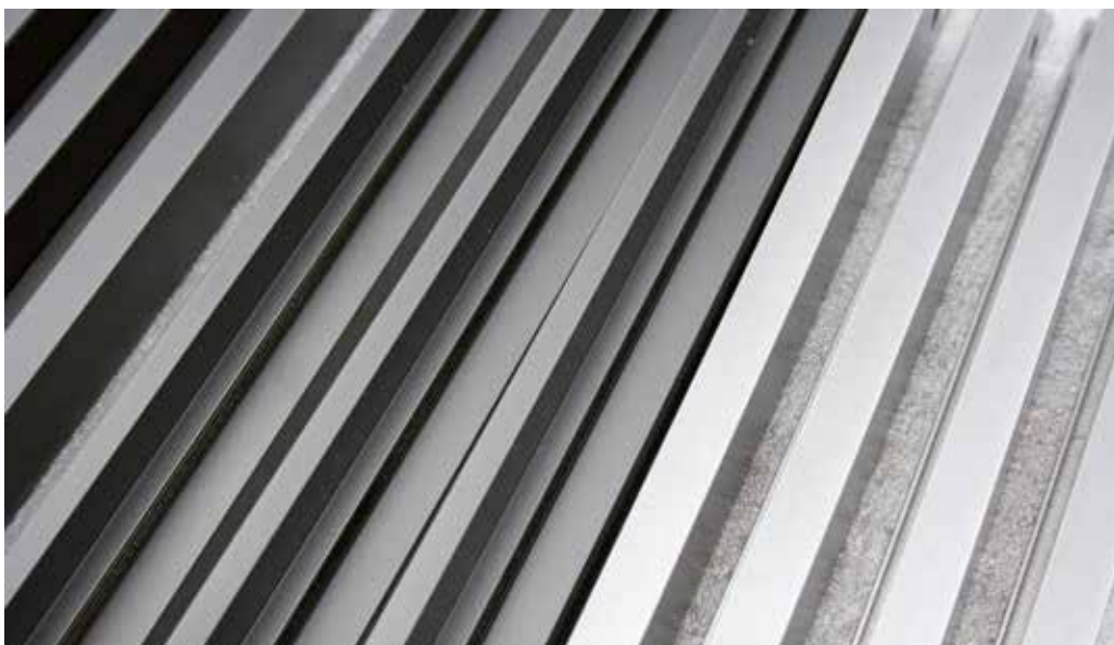
6 e 7 - Dettaglio di profili per la componentistica del mobile, trattati con vernici ad "effetto metallo". L'attuale trend è infatti un colore brunito o acciaio ottenuto con una polvere metallizzata.

Les peintures métallisées permettent d'obtenir ces effets car à l'intérieur de la formulation des finitions Stardust il y a des pigments métalliques qui créent effets différents, selon l'incidence de la lumière sur le produit fini, en étant au même temps des peintures opaques agréables au toucher et avec une uniformité indéniable.